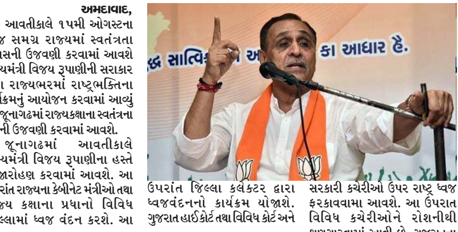
અમદાવાદ, આવતીકાલે ૧૫મી ઓગસ્ટના રોજ સમગ્ર રાજ્યમાં સ્વતંત્રતા દિવસની ઉજવણી કરવામાં આવશે. મુખ્યમંત્રી વિજય રૂપાણીની સરકાર પુરા રાજ્યભરમાં રાષ્ટ્રભક્તિના કાર્યક્રમનું આયોજન કરવામાં આવ્યું છે. જૂનાગઢમાં રાજ્યકક્ષાના સ્વતંત્રતા પર્વની ઉજવણી કરવામાં આવશે. જૂનાગઢમાં આવતીકાલે મુખ્યમંત્રી વિજય રૂપાણીના હસ્તે ધ્વજારોહણ કરવામાં આવશે. આ ઉપરાંત રાજ્યના કેબીનેટ મંત્રીઓ તથા રાજ્ય કક્ષાના પ્રધાનો વિવિધ જિલ્લામાં ધ્વજ વંદન કરશે. આ ઉપરાંત જિલ્લા કલેક્ટર દ્વારા ધ્વજવંદનનો કાર્યક્રમ યોજાશે. ગુજરાત હાઈકોર્ટ તથા વિવિધ કોર્ટ અને સરકારી કચેરીઓ ઉપર રાષ્ટ્ર ધ્વજ ફરકાવવામાં આવશે. આ ઉપરાંત વિવિધ કચેરીઓને રોશનીથી શણગારવામાં આવી છે. ગુજરાતના ૧૭ જેટલા પોલીસ અધિકારી-કર્મચારીઓનું રાષ્ટ્રપતિ પોલીસ મેડલથી સન્માનિત કરવામાં આવશે. રાજ્યની અને કે સંસ્થાઓ ખાતે સ્વતંત્રતા પર્વની ઉજવણી કરવામાં આવશે.

સરકારી કચેરીઓ ઉપર રાષ્ટ્ર ધ્વજ ફરકાવવામાં આવશે. આ ઉપરાંત વિવિધ કચેરીઓને રોશનીથી શણગારવામાં આવી છે. ગુજરાતના ૧૭ જેટલા પોલીસ અધિકારી-કર્મચારીઓનું રાષ્ટ્રપતિ પોલીસ મેડલથી સન્માનિત કરવામાં આવશે. રાજ્યની અને કે સંસ્થાઓ ખાતે સ્વતંત્રતા પર્વની ઉજવણી કરવામાં આવશે.